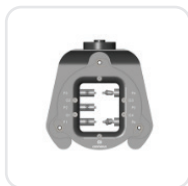
Держатель под премилы