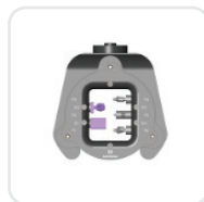
Держатель под премилы и стеклокерамику