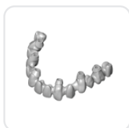
Мост на винтовой фиксации