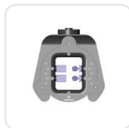
Держатель для стеклокерамики