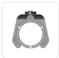
Стандартный держатель диска