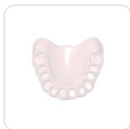
Denture - Type 1