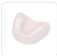
Denture - Type 2